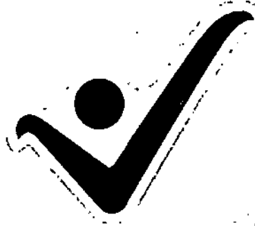
FIGURA 7. Forma del sello positivo

Parágrafo. No se puede utilizar otro tipo de forma de sello positivo, ni cambiar el color, añadir letras o frases, ni tamaños, ni ubicación.