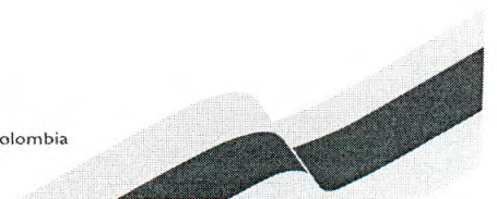
EDUARDO IGNACIO VERANO DE LA ROSA Gobernador del departamento del Atlántico